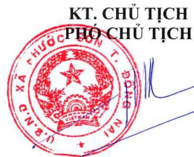
Bùi Anh Tuấn